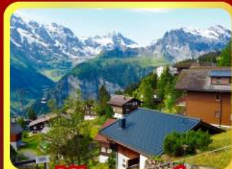
หมู่บ้านเมอร์สเรน