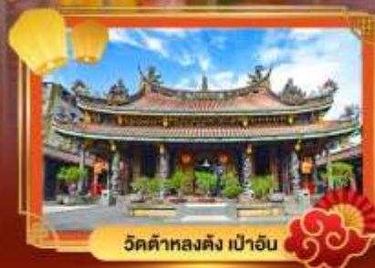
วัดต้าหลงตง เป่าอัน